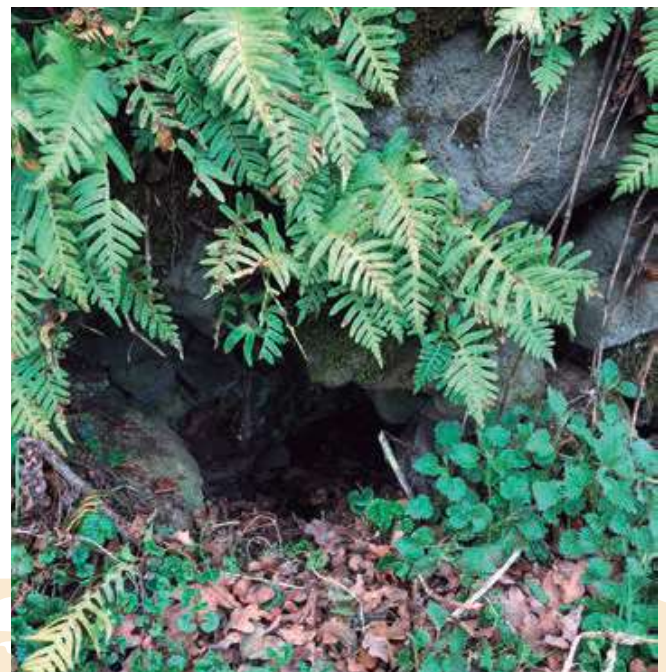
Prop de Cal Serrador

L'altre està integrat en un marge, una mica separat de la casa (foto portada). Aquest servia exclusivament per mantenir la beguda en fresc quan es treballava al camp. Igualment com passava amb el que hi ha en el quintà de Ca l'Andreu, que té la mida justa per deixar-hi un càntir o el que hi ha en un marge prop de Cal Serrador.