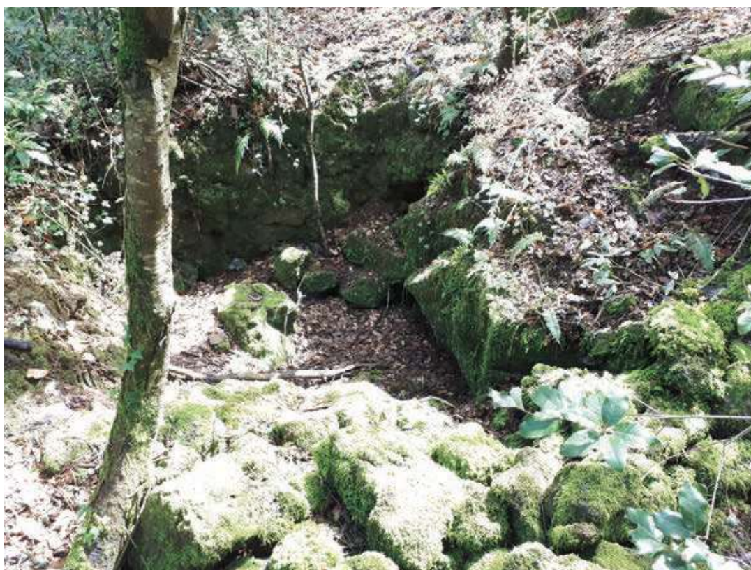
Bassa prop del bufador de Rubau