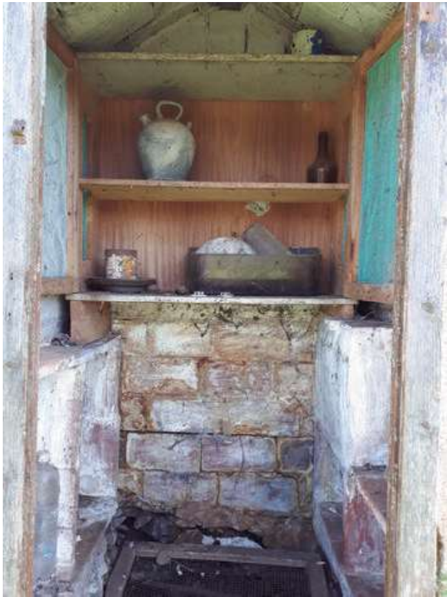
Interior amb armari obert