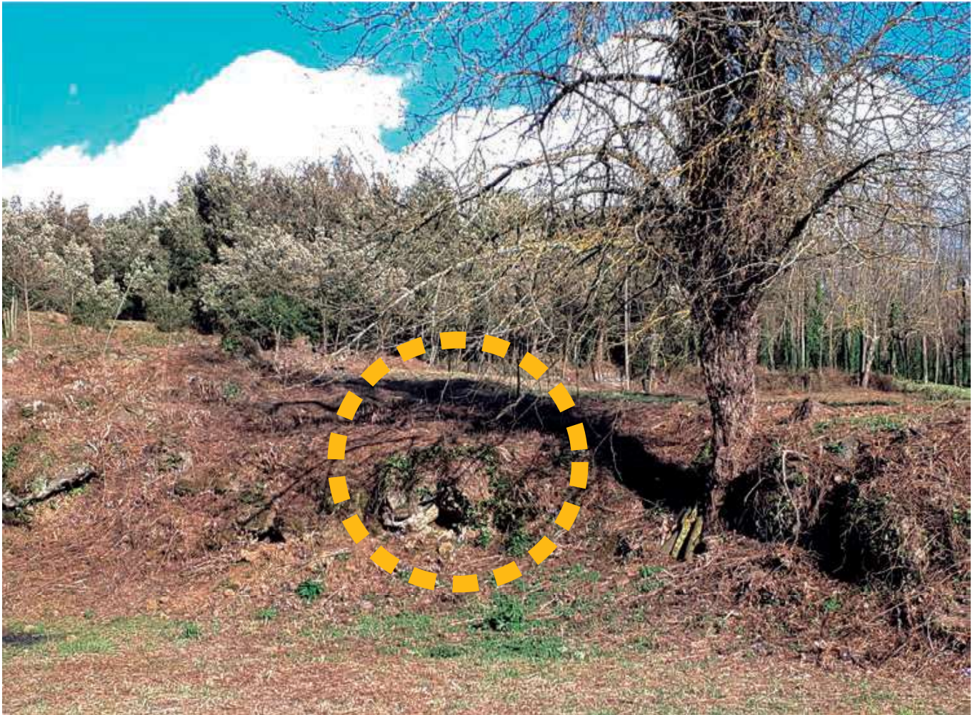
Quintà de sota Ca l'Andreu