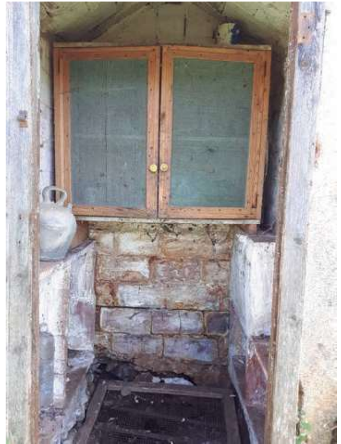
Interior amb armari tancat

Bufadors de Bellvespre: n'hi ha dos. Un està molt a prop de la casa, també utilitzat per guardar-hi menjar i begudes. S'havia fet servir de frigorífic fins que no va arribar aquest electrodomèstic a totes les cases. Tot i això va conviure amb aquests aparells, ja que es considerava que el bufador mantenia una frescor més natural. Tant és així, que s'hi va construir una caseta amb lleixes i un armari amb porta inclosa, vaja, un autèntic rebost!. La Verònica de Bellvespre recorda que quan era peticona, el dia que es "cosetxava" els homes s'asseien al voltant del bufador on els hi portaven el menjar i tenien el porró i el càntir en fresc.