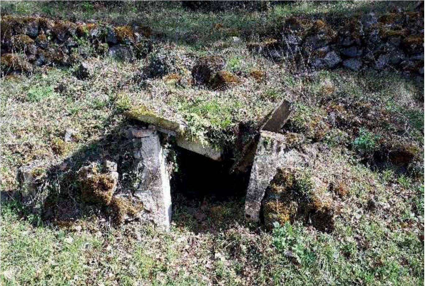
Bufador de Can Ramon