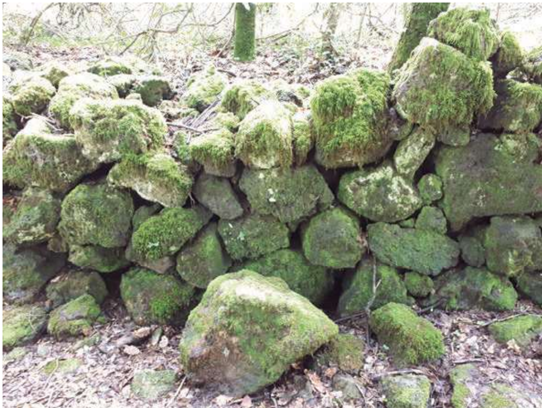
Bufador del bosc de Rubau