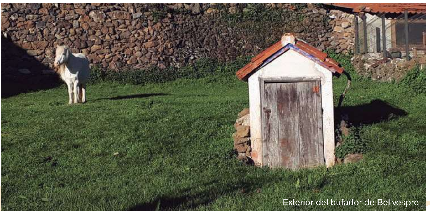
Exterior del bufador de Bellvespre