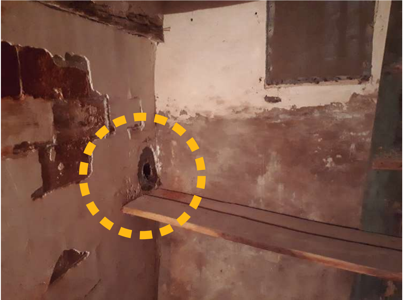
Bufador del rebost del mas Roure