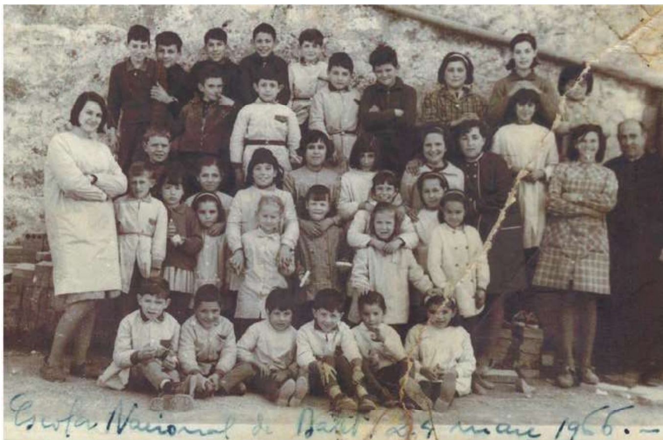
Alumnes de l'escola de Batet - 1966 (Foto 2)

A finals dels 60, a la comarca de La Garrotxa, es va donar el fet que petits pobles es van agrupar per tal de concentrar la gestió municipal en un únic ajuntament. El 1971, Batet també va deixar de tenir ajuntament propi i va passar a formar part de la ciutat d'Olot. L'escola es va mantenir dos anys més, però l'aula va quedar buida el curs 1973-74, moment en que hi havia 13 alumnes matriculats d'edats compreses entre tres i catorze anys. A partir d'aquell moment l'escola de Batet va quedar adscrita al llavors anomenat Grup Esclar Malagrida.