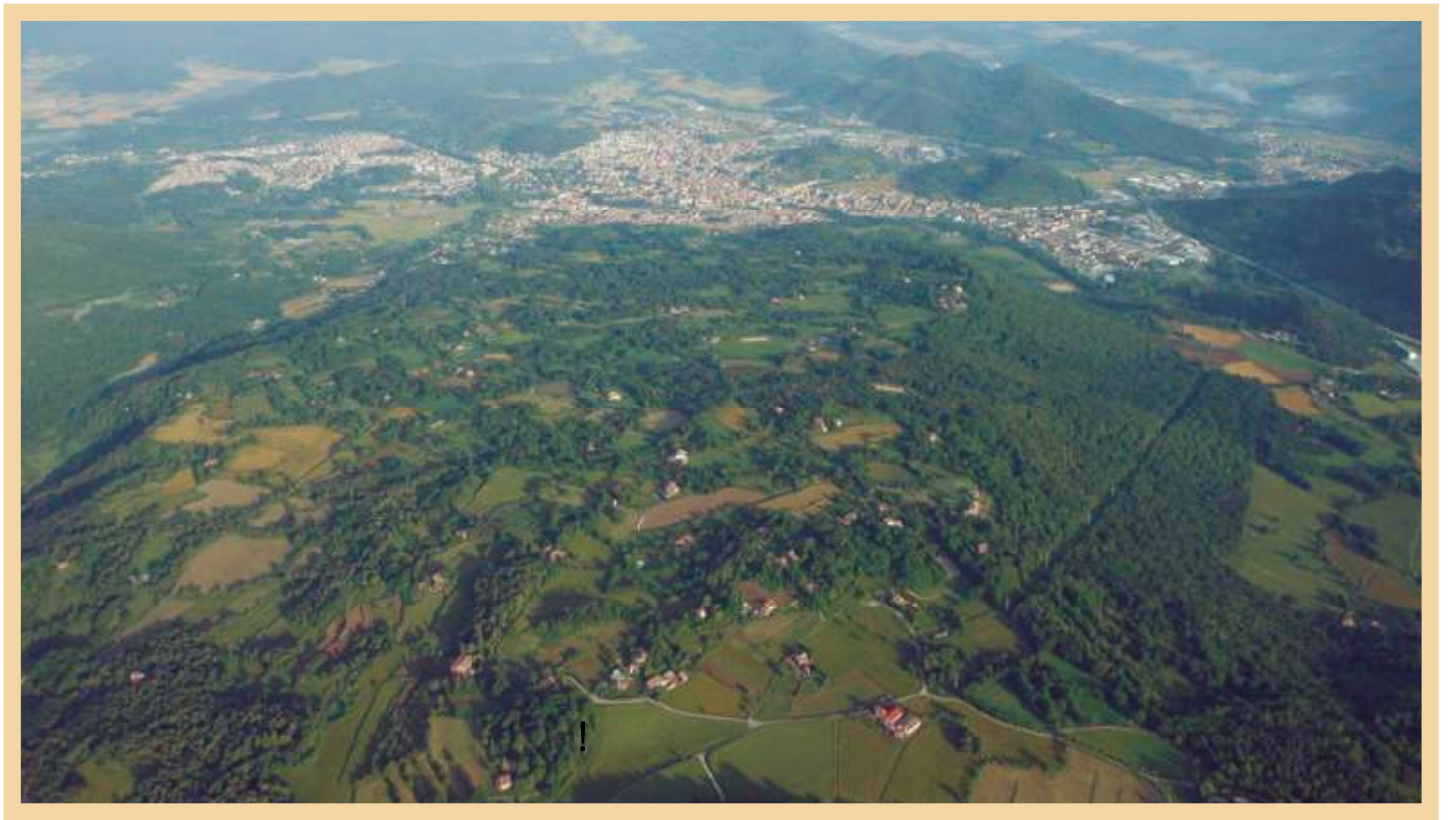
Vista aèria de Batet amb Olot al fons (foto 1)