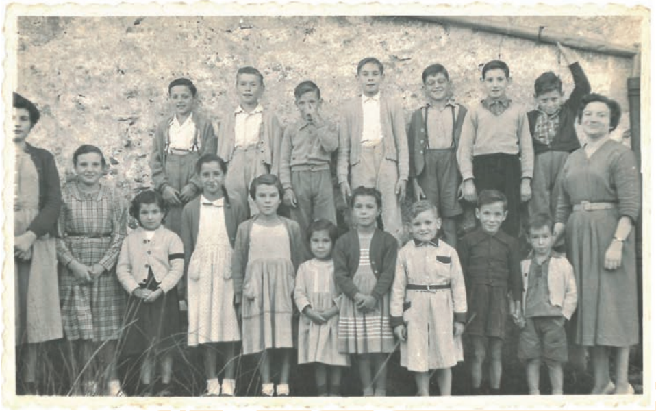
Nens i nenes de l'escola de mitjans del segle passat.

Veient aquestes dades, sorprèn els 106 alumnes matriculats el 1928-29. Caldria fer una recerca més a fons per conèixer els motius d'aquest augment de natalitat. En canvi, a partir de mitjans del segle passat, el nombre de nens i nenes es va anar reduint curs rere curs. Aquí sí que en coneixem el motiu: a partir de finals dels anys 60, l'abandonament del món agrícola per anar a treballar a les fàbriques i a viure a la ciutat va anar augmentant fins al punt que moltes cases van quedar sense masovers i la població es va reduir considerablement.