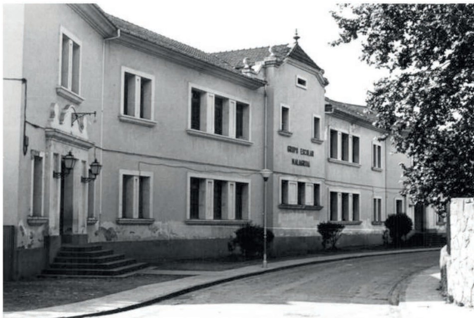
Entrada de l'Escola Malagrida.