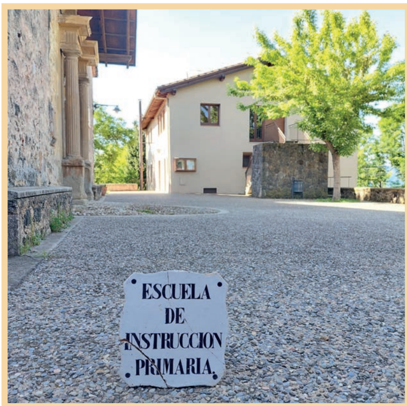
Placa amb la Casa Consistorial al fons (a la planta baixa hi havia l'escola)