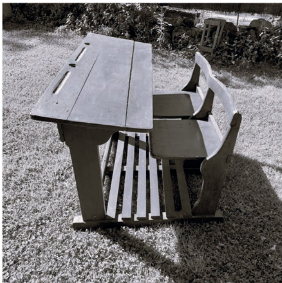
Pupitre de l'escola de Batet (guardat a La Rectoria)

Provenint d'una escola unitària, un dels canvis més importants va ser deixar d'estar tots a la mateixa aula. A partir d'aquell moment, quedarien repartits en diferents grups segons l'edat i el sexe, ja que els nens i les nenes anirien en grups separats. Així, només coincidien tots a l'autocar de baixada i pujada. L'esforç per adaptar-se a la nova escola va ser especialment rellevant per als més grans, als qui els quedaven pocs anys per acabar l'EGB i que fins llavors havien compartit totes les hores a la mateixa aula amb una sola mestra que ensenyava des dels més petits fins als més grans. Precisament per això, la Carme Aumatell, una de les veïnes de Batet que va viure aquesta transició, recorda estar molt preocupada de no tenir prou "nivell" acadèmic en anar a la nova escola. Per sort, aquestes pors es van esvaïr ràpidament quan va veure que no tenia cap dificultat per seguir el ritme del grup que li corresponia per edat.